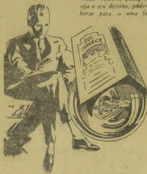
Todo homem, qualquer que seja o seu destino, poderá elaborar para si uma fortuna.

ESCOLA SMITH PREMIER OFFICIAL — João Pessoa — Esta escola expede diploma de guarda-livros, dactylographia e tachygraphia. Preparam-se rapazes e moças para o commercio, leccionando-se as seguintes materias: Dactylographia, Ta-